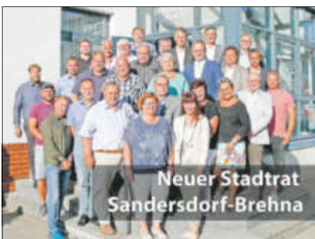
Neuer Stadtrat Sandersdorf-Brehna

In der konstituierenden Sitzung am 2. Juli wurden die neuen Stadträte zur uneigennütigen und verantwortungsvollen Übernahme ihrer ehrenamtlichen Tätigkeiten verpflichtet, der neue Stadtratsvorsitzende und seine Stellvertreter gewählt sowie die Vorsitz der Ausschüsse und weitere Funktionen benannt.