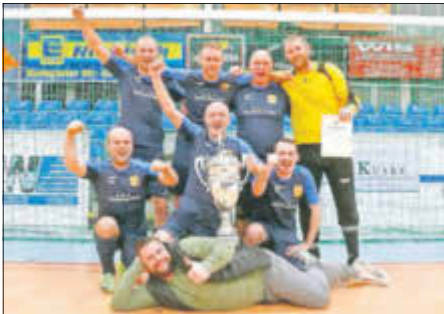
Der SV Roitzsch hat den 10. Bürgermeisterpokal gewonnen.

Der Bürgermeister hat geladen und traditionell beteiligten sich die Altherrenmannschaften aus dem Stadtgebiet. Im Finale hat der SV Roitzsch gegen den MSK Sandersdorf mit 3 : 0 gewonnen.