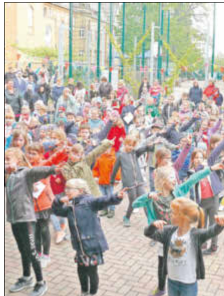
Tanzen verbindet! Hier der Shuffle-Tanz des Tanzwerks.