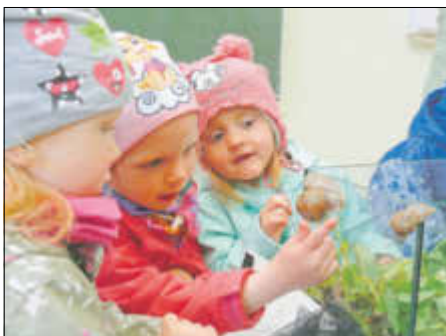
Eine Begegnung der anderen Art? Die Schnecken vom BUND konnten „rundum“ bestaunt werden.

Am 2. Mai fand in der Grundschule in Zscherndorf das erste Begegnungsfest statt!