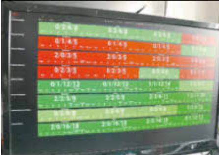
Am Monitor hat man den Überblick über die gesamte aktuelle Einsatzstärke.

Die Stadt Sandersdorf-Brehna hat seit Mai 2019 für die Feuerwehr ein neues Alarmierungssystem eingeführt, das neben der Sirene und dem digitalen Funkmeldeempfänger ein weiteres wichtiges Mittel zur Alarmierung unserer Feuerwehrkräfte ist.