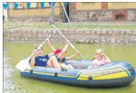
Spaß im Schlauchboot

„Willkommen ist, wer kommen will“ - das Motto des Heideloher Teichfestes zog wieder viele Besucher an. Verbunden mit 85 Jahre FF Heideloh gab es ein Badewannenrennen mit Feuerwehr-Teich-Parcours. Es wurde getanzt, gekegelt, genascht, gesungen und gelacht. So soll das sein!