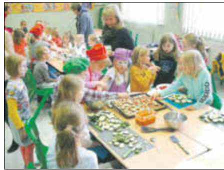
Gemeinsam kochen gehörte natürlich auch dazu!

Ob Tanzworkshop, Basketball, Fußball, Märchenspiel, Schnecken-Terrarium, Koch- und Malworkshop, Feuerwehr, Hüpfburg, Blinden-Tischball oder Straße der Sinne zum Riechen, Tasten usw. Für alle war hier etwas dabei!