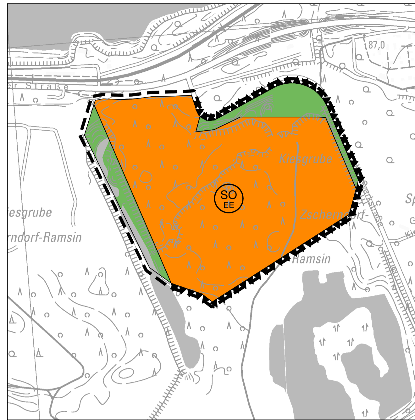
Topographische Karte (DTK10)

Die 2. Sachliche Teiländerung des Flächennutzungsplanes der Stadt Sandersdorf-Brehna in der Gemarkung Ramsin wird hiermit ausgefertigt.