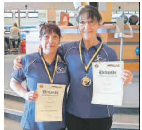
Landesmeister im Doppel der Damen