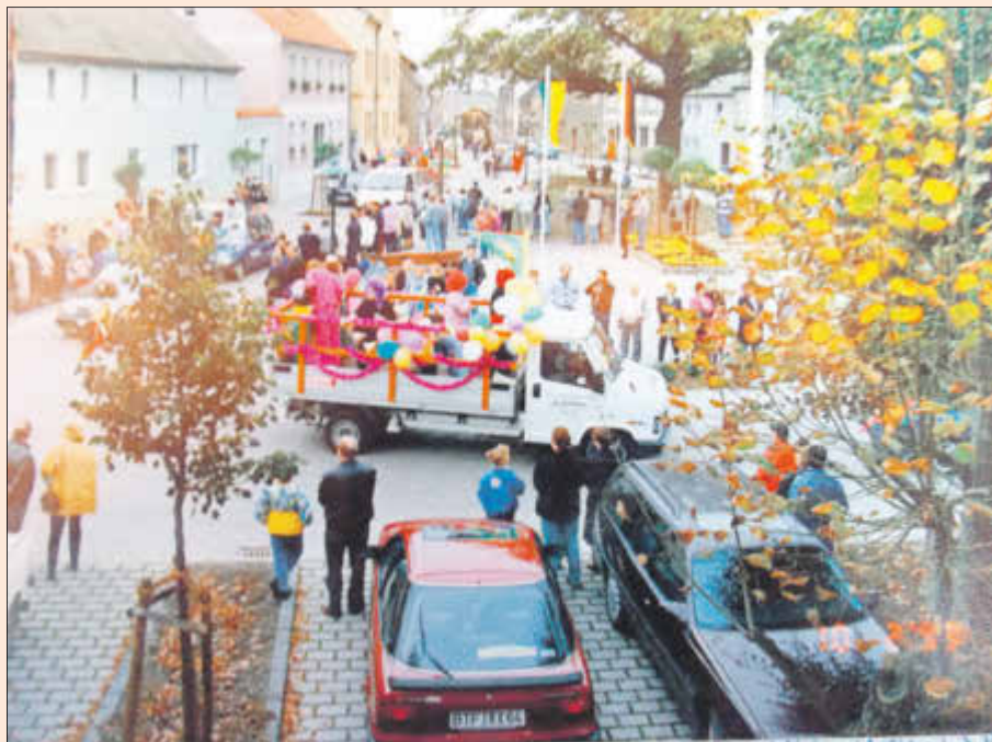
Festumzug in Roitzsch zur 950-Jahr-Feier

... Eduard, der Bekenner wird in Winchester zum König von England gekrönt. In Europa herrscht eine große Hungersnot. Heinrich III, König im römisch-deutschen Reich heiratet in Ingelheim Agnes von Poitou.