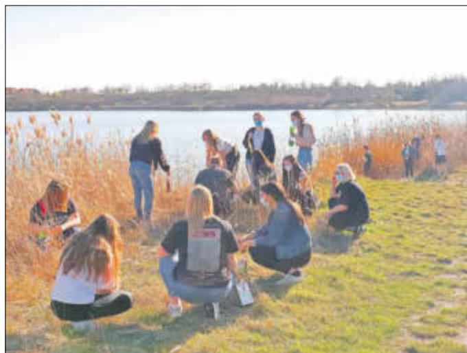
Für Suchen und Naschen ist man nie zu alt.