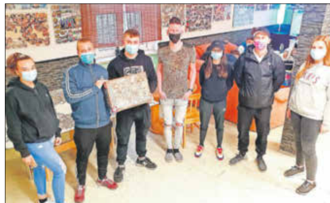
Ein Weltenbummler zu Gast im Jugendclub.