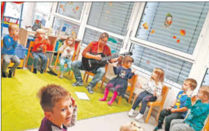
Gemeinsam singen und fröhlich sein.