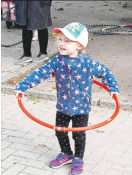
Wir können Hula-Hoop.