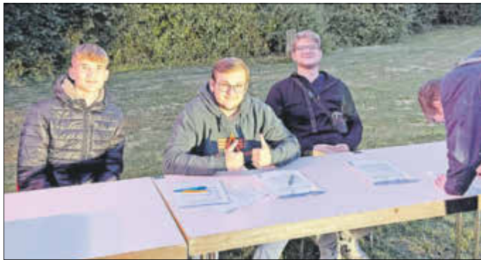
Mitglieder des Jugendbeirats am Eingang