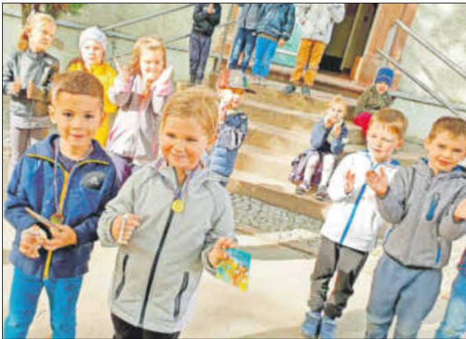
Dem Herbst singen wir schöne Lieder.