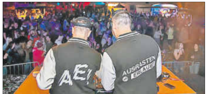
Das DJ-Duo „Ausrasten erlaubt“ - Name ist Programm!