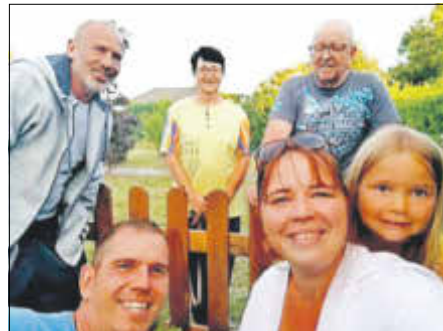
Das Team hinter der Insektenoase Glebitzsch.