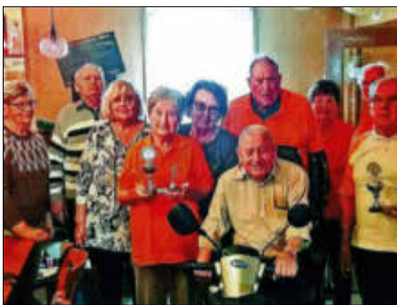
Auch die Seniorinnen und Senioren freuen sich, endlich wieder zu bowlen.

Am 31.08.2021 von 10 – 12 Uhr hatte die Seniorengruppe Bitterfeld-Sandersdorf-Brehna auf der Bowlingbahn der Gaststätte „SPORTIs - Kultlokal - Bowling & Restaurant“ ihren Bowling-Wettkampf und Informationsaustausch aufgenommen. Die Ergebnisse sind wie folgt: