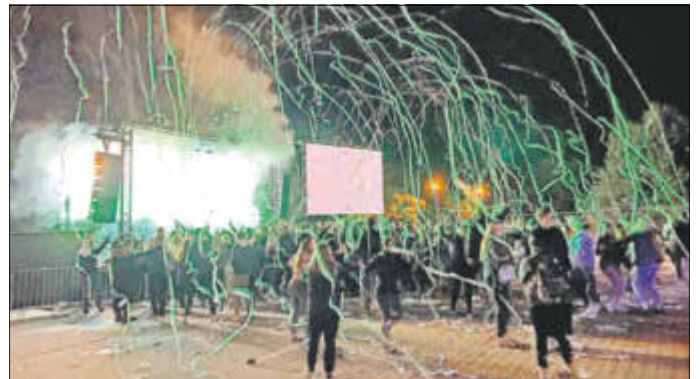
Am Sportzentrum wurde ordentlich gefeiert - und hinterher auch aufgeräumt!