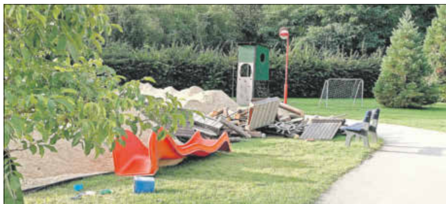
Das Piratenschiff in der Kita wurde abgebaut.

Am 23.09.2021 hieß es bei uns in der Kita Glückspilz für Groß und Klein Abschied nehmen. Abschied von unserem Holzschiff auf dem Außenspielgelände. Über zehn Jahre lang war es ein tolles Spielgerät, welches wohl in so mancher Phantasie etliche Reisen auf Ozeanen und Meeren angetreten hat und worauf sich viele Piraten und Piratenprinzessinnen mit ihren Goldschätzen wohlgeföhlt haben. Ein echter Blickfang war es für alle in der Kita, sei es zum Tag der offenen Tür oder beim Besuch ausländischer Delegationen. Nun sagen wir „Goodbye“ und nicht „Auf Wiedersehen“, denn das „Meer“ drum herum wird trockengelegt. Mit Spannung erwarten die Glückspilze den Bau und die baldige Fertigstellung des neuen Spielgerätes,