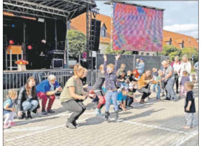
Beim Schildkrötenmambo gab es vollen Einsatz!