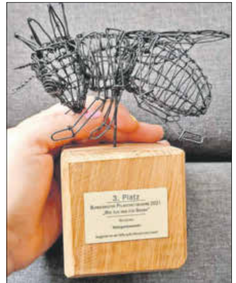
Der Pokal zur Auszeichnung.