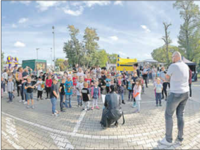
Aufmerksam wird der Geschichte über Schildegart und ihren Freunden gelauscht.