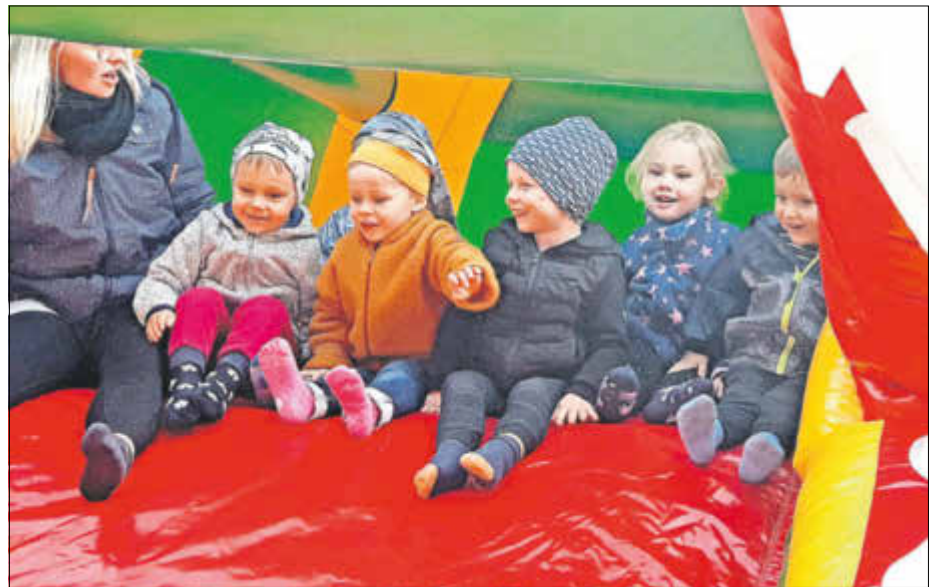
Eine Hüpfburg macht immer Spaß.