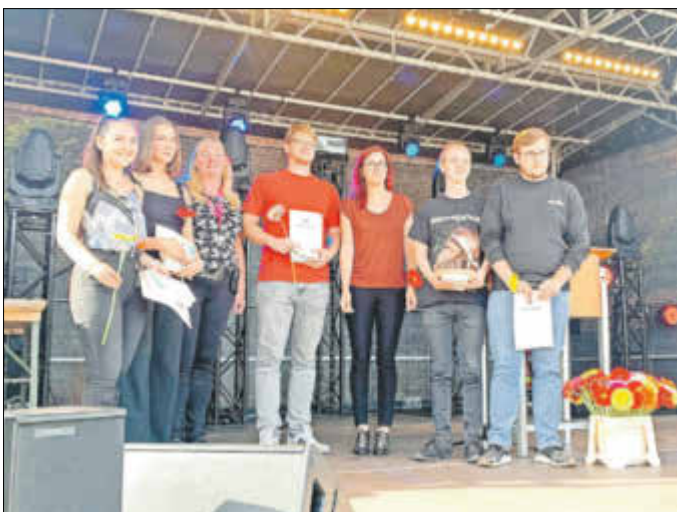
Die Auszeichnung des „alten“ Jugendbeirates