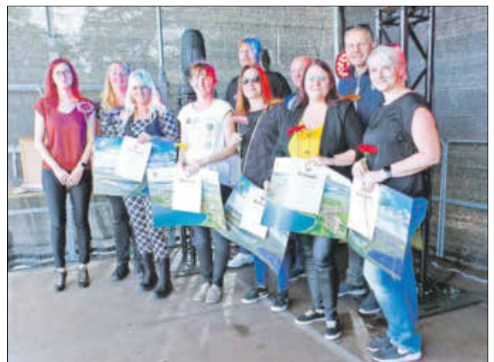
Sie haben in der Pandemie-Krise nicht den Kopf hängen lassen.