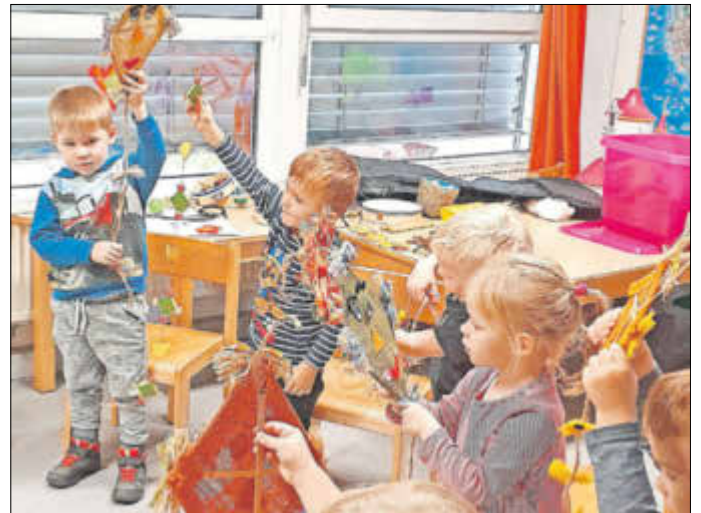
Selbst gebastelte Drachen