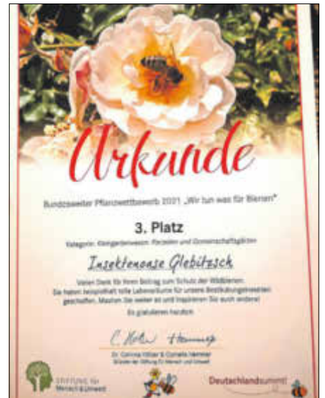
Die Urkunde der Stiftung Mensch und Umwelt.