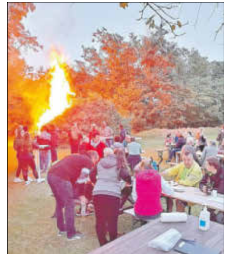
Licht und Wärme vom Baumschnitt