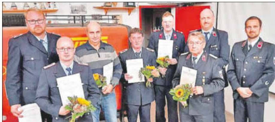
Beförderte und Jubilare FF Heideloh