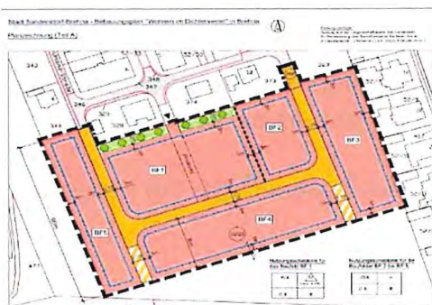
Abb. 1 Abbildung aus den Planunterlagen

Der Geltungsbereich befindet sich auf dem Flurstück 368 und teilweise auf dem Flurstück 52/23 in der Flur 4 der Gemarkung Brehna (Abb. 1) und umfasst eine Ackerfläche (Abb. 2) von ca. 13.710 m 2 .