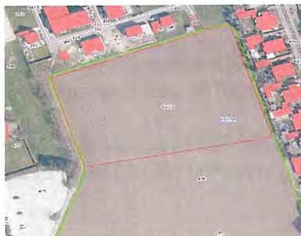
Abb. 2 Auszug aus dem webGIS