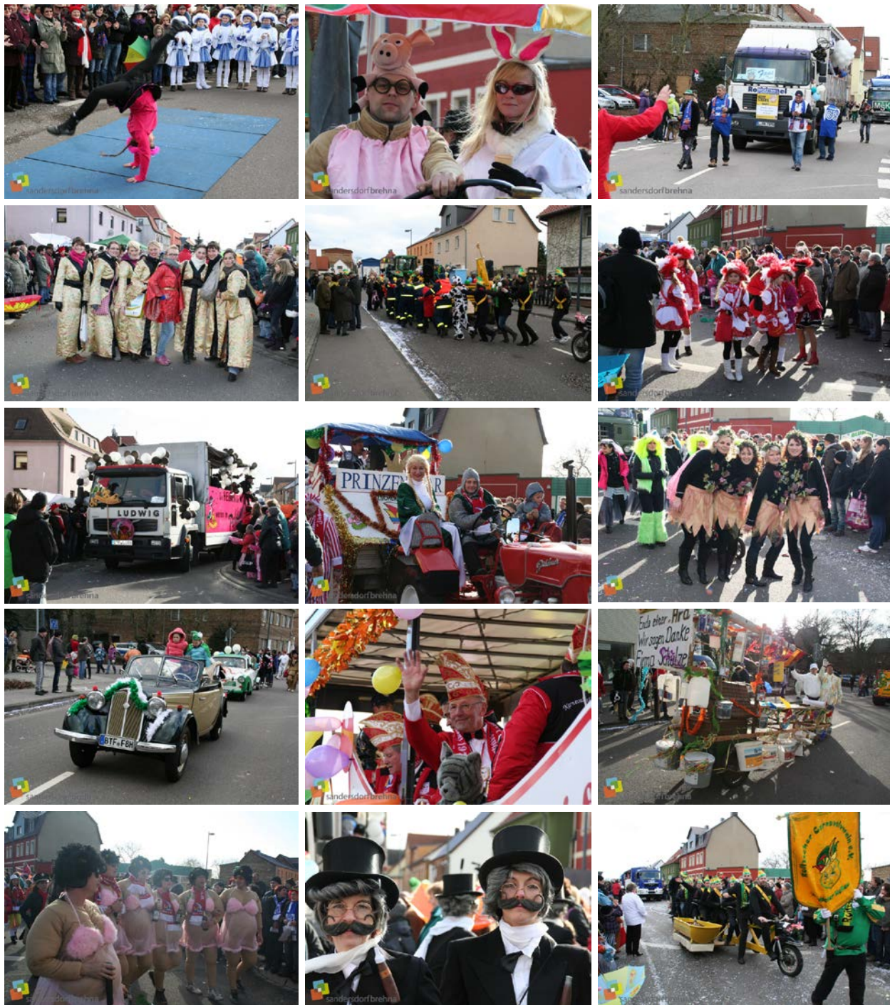
Bild [8-22]: 19.02.2012, Straßenkarneval in Sandersdorf-Brehna

Großer Karnevalsumzug durch Sandersdorf-Brehna mit allen fünf Vereinen aus der Stadt Sandersdorf-Brehna sowie befreundeten Vereinen aus dem Landkreis Anhalt-Bitterfeld, Sportgruppen, Gaststätten, Straßengemeinschaften, Gewerbetreibenden und einzelnen privaten Teilnehmern.