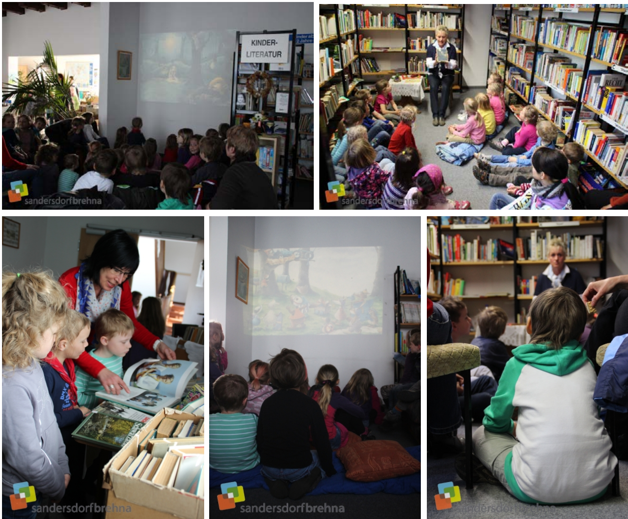
Bild [42-46]: 23.04.2012, Welttag des Buches in der Stadtbibliothek