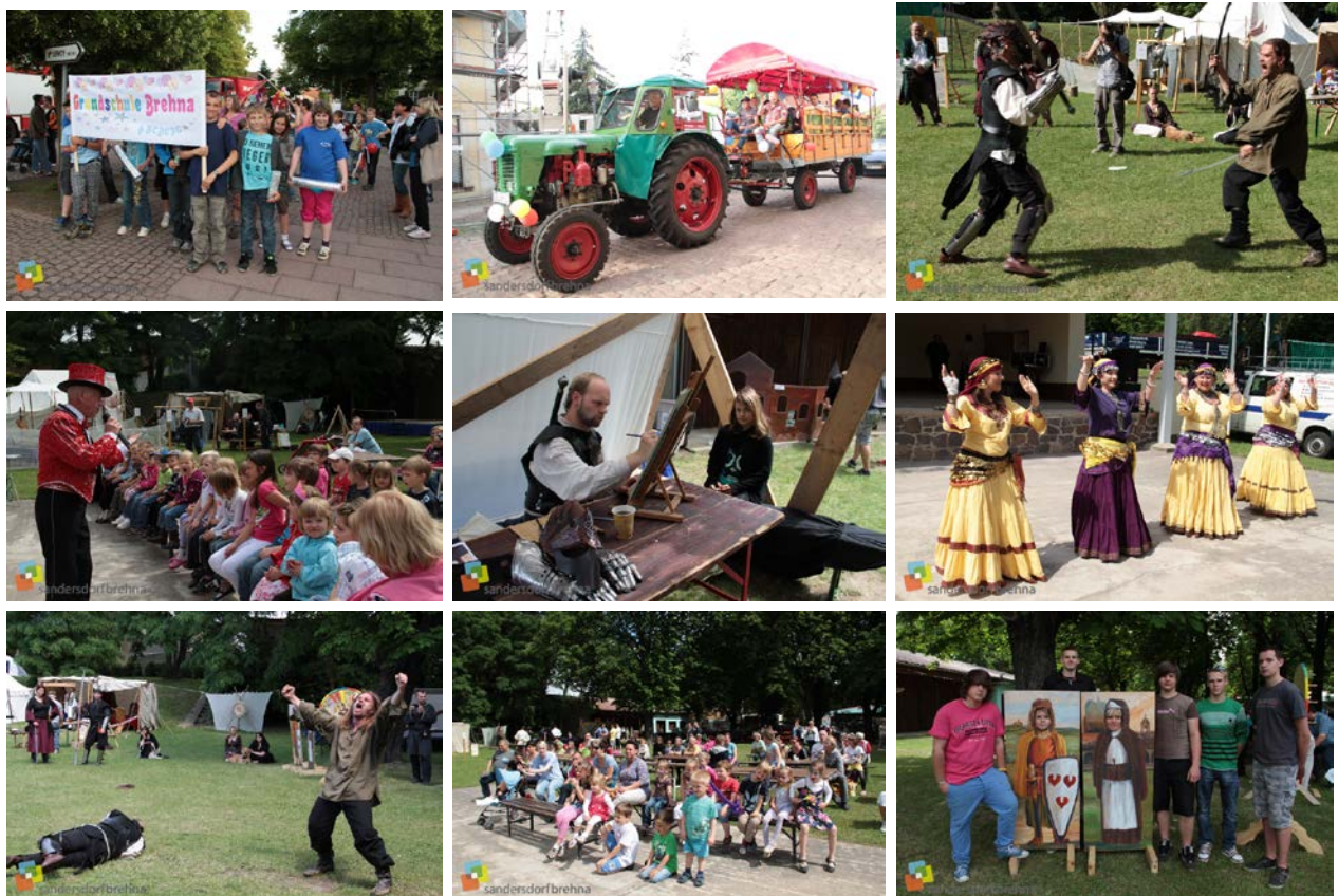
Bild [67-75]: 08.06.2012, Kinder- und Heimatfest Brehna

Kinder- und Heimatfest mit Mittelalterspektakel auf dem Schützenplatz.