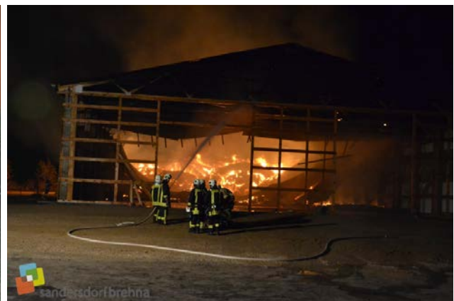
Bild [100-101]: 24.10.2012, Lagerhallenbrand Renneritz