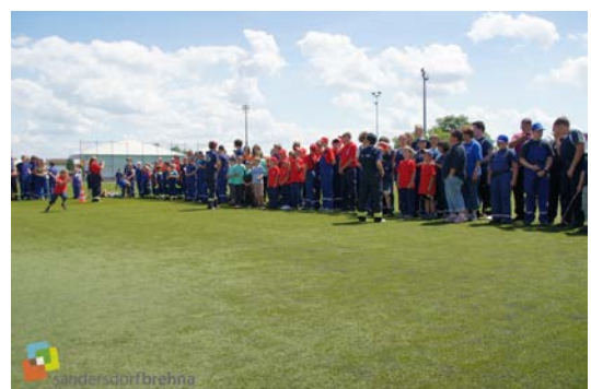
Bild [87]: 23.06.2012, Spiel ohne Grenzen

„Spiel ohne Grenzen“ auf dem Sportplatz, organisiert und veranstaltet von der Jugendfeuerwehr Sandersdorf. 23 Jugendfeuerwehrmannschaften messen sich im sportlichen Wettkampf.