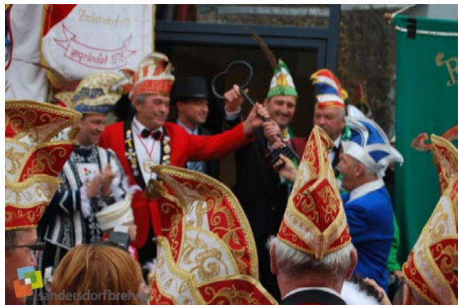
Bild [102]: 11.11.2012, 11:11 Uhr am Rathaus Sandersdorf-Brehna