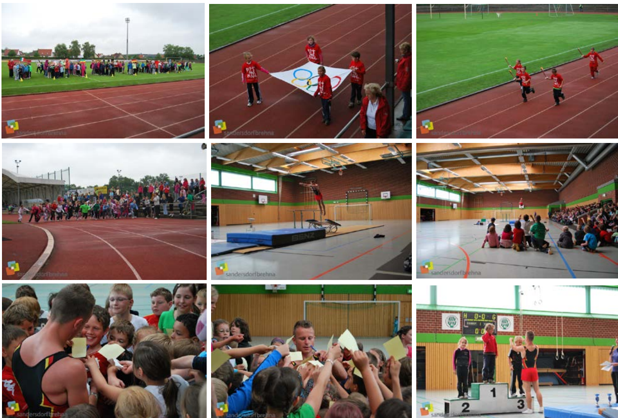
Bild [58-66]: 01.06.2012, Olympische Spiele der Grundschulen Sandersdorf und Zscherndorf