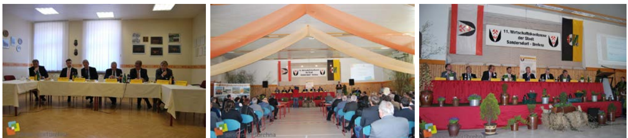
Bild [33-35]: 28.03.2012, Wirtschaftskonferenz der Stadt Sandersdorf-Brehna