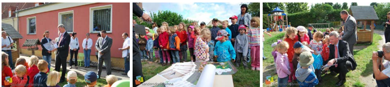
Bild [94-96]: 12.07.2012, Übergabe der „Natura-Projekt“ Lernmaterialien