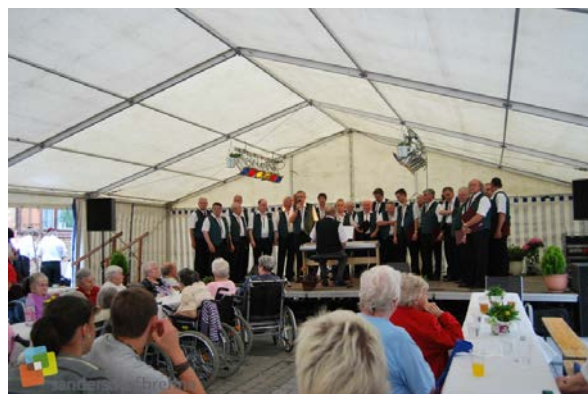
Bild [81]: 16.06.2012, Senioren-Sommer-Sause

2. Senioren Sommer Sause: Begegnung der Generationen am Platz der Deutschen Einheit.