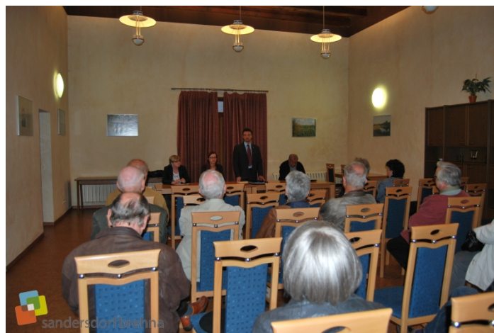
Bild [32]: 26.03.2012, Einwohnerversammlung

Einwohnerversammlung im Bürgerraum des Paul Othma Hauses am Sportzentrum. Neben Allgemeinem standen Informationen zu den getätigten Investitionen im Jahr 2011, den geplanten Investitionen im Jahr 2012, die Entwicklung der Stadt, ordnungsrechtliche sowie Kinder- und Familienangelegenheiten auf der Tagesordnung.