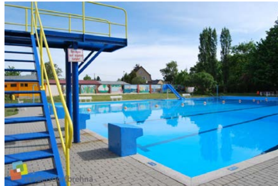
Bild [52-54]: 18.05.2012, Eröffnung Freibad Roitzsch