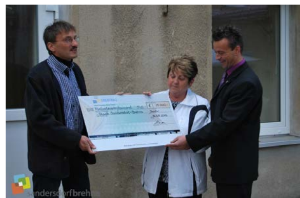
Bild [51]: 16.05.2012, Scheckübergabe

Die Firma ENERTRAG AG, die in der Ortschaft Roitzsch ein Windfeld mit 16 Anlagen betreibt, spendet der Ortschaft 25.000 Euro.