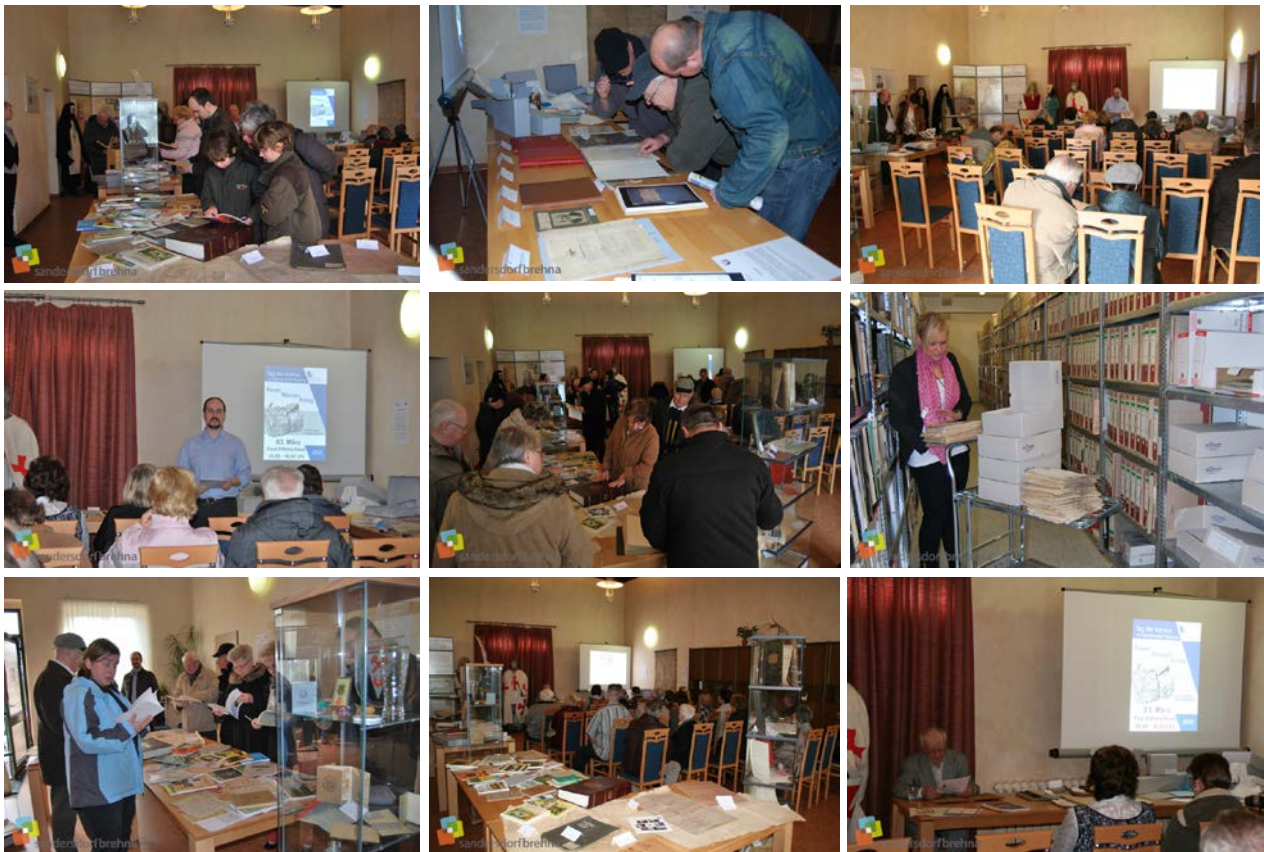
Bild [23-31]: 03.03.2012, 1. „Tag der Archive“ im Stadtarchiv Sandersdorf-Brehna

1. „Tag der Archive“ im Stadtarchiv Sandersdorf-Brehna. Das Stadtarchiv öffnet unter dem Motto „Feuer, Wasser, Krieg und andere Katastrophen“ die Türen für alle interessierten Bürgerinnen und Bürger.