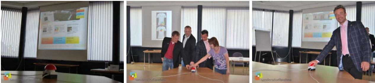
Bild [55-57]: 31.05.2012, Pressekonferenz zum Onlinegang der Website www.sandersdorf-brehna.de

Die Stadt Sandersdorf-Brehna präsentiert ihr neues Logo und startet den neuen Webauftritt.