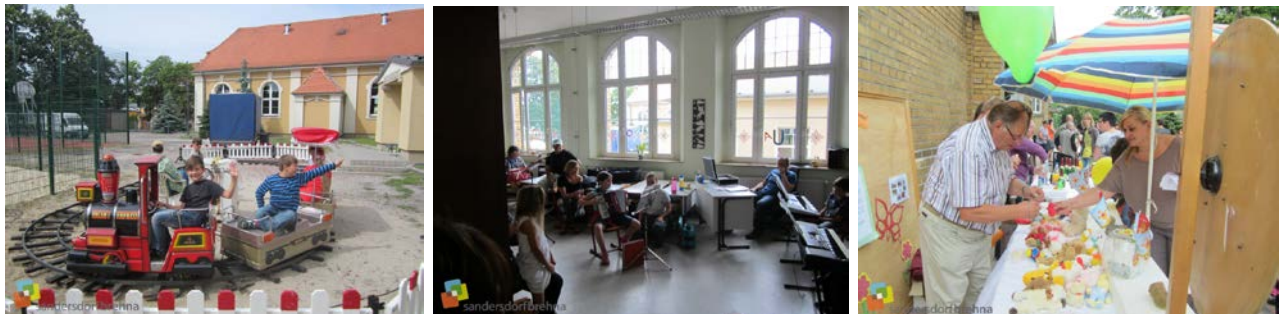
Bild [76-80]: 15.06.2012, Tag der offenen Tür in der Kita „Max und Moritz“ und der Grundschule