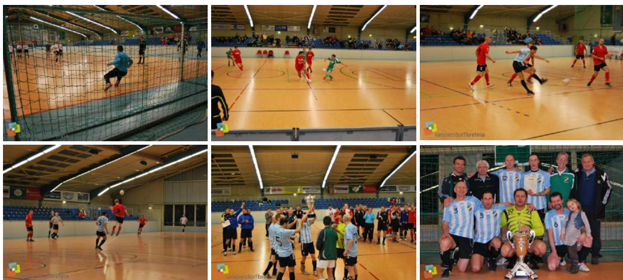
Bild [1-6]: 27.01.2012, 3. „Bürgermeistercup“ Sandersdorf-Brehna