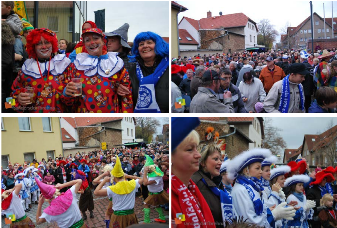
Bild [103-106]: 11.11.2012, 11:11 Uhr am Rathaus Sandersdorf-Brehna