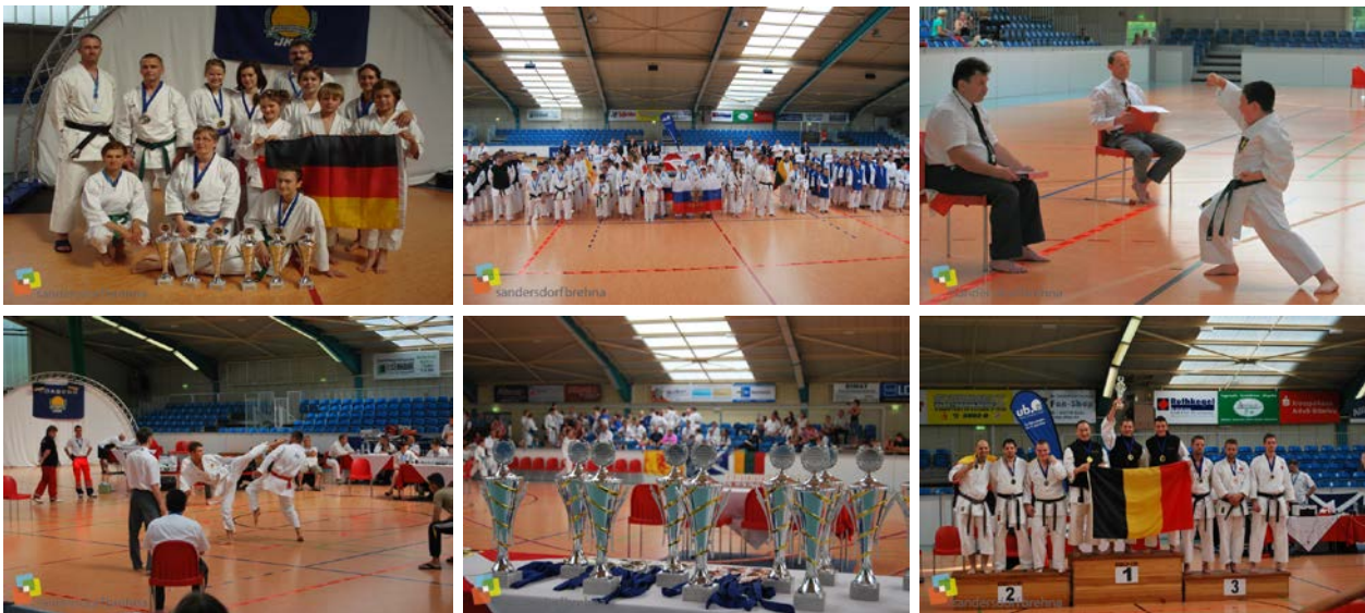
Bild [88-93]: 08.07.2012, WJKA Europameisterschaft