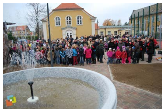
Bild [107-110]: 16.11.2012, Einweihung des neuen Ortszentrums Zscherndorf

Einweihung des neu gestalteten Ortszentrums. Das Geschwister-Scholl-Heim, das Kriegerdenkmal mit neu geschaffenem Brunnen und das Außengelände der Feuerwehr erstrahlen in neuem Glanz.