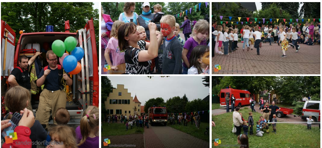
Bild [82-86]: 21.06.2012, Sommerfest Kindertagesstätte „Pfingstanger“

Sommerfest der Kindertagesstätte „Pfingstanger“.