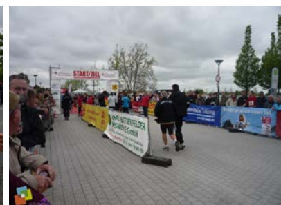
Bild [47-50]: 06.05.2012, Stadt-Staffel beim 7. Goitzsche Marathon