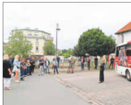
Alle Beteiligten sind gekommen, um den Bus endlich zu sehen.

Vielen herzlichen Dank an alle Beteiligten für das Mitwirken an diesem tollen Projekt!