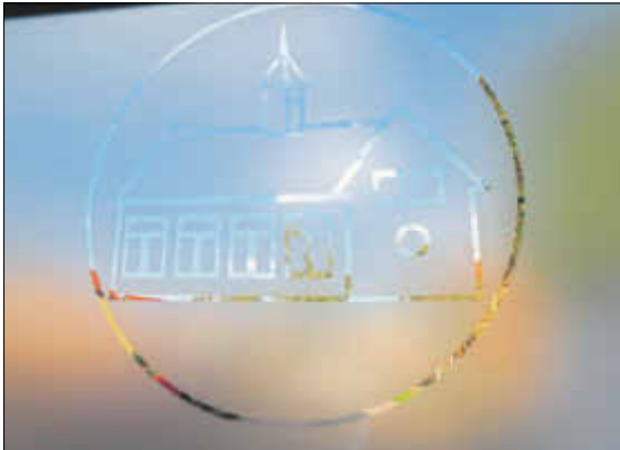
Die Sichtfolie an der Außentür.

Presse- und Öffentlichkeitsarbeit/ Stadtmarketing