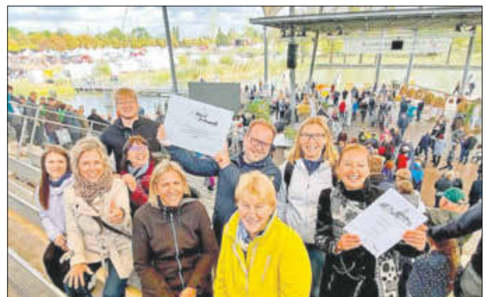
Die Veranstaltung fand im Elbauenpark in Magdeburg statt.