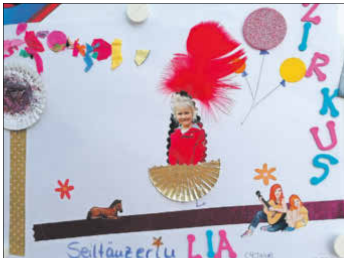
gestaltet von Lia Derlitzki: Conni im Zirkus: Liane Schneider