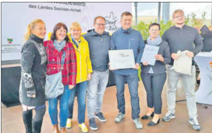
Die Freude war groß zur Auszeichnung zum 2. Platz.