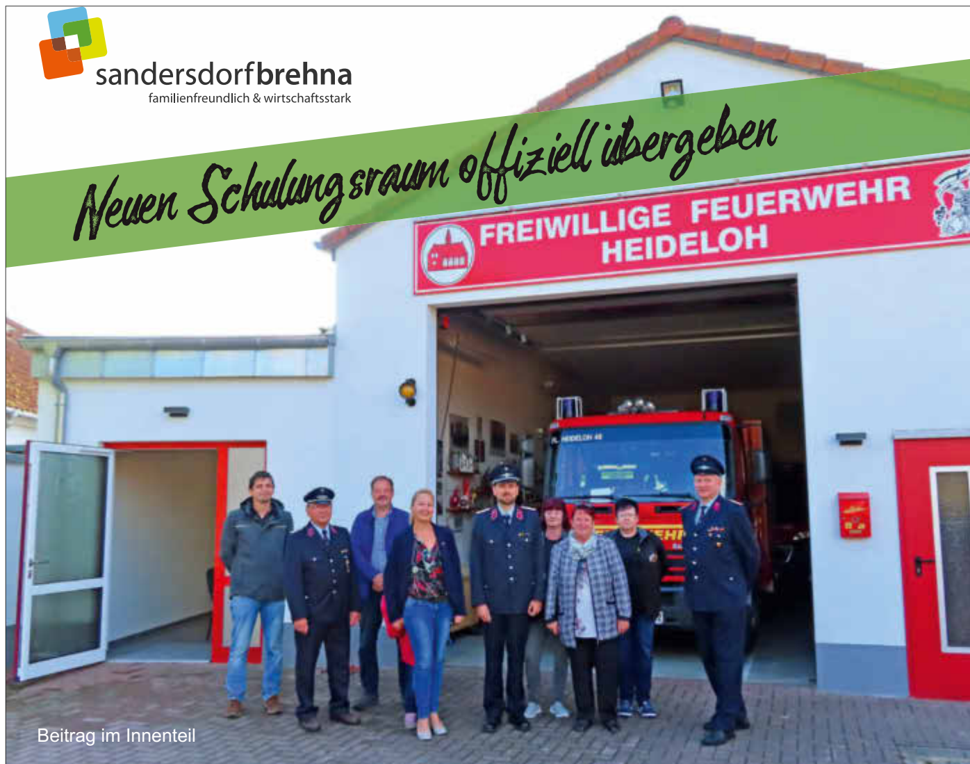
Beitrag im Innenteil