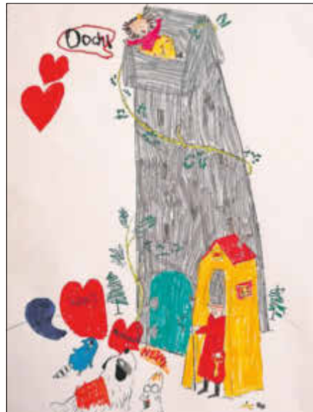
gemalt von Isabella Heilemann: Das Neinhorn : Marc Uwe Kling