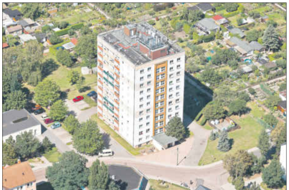
Neue Bitterfelder Wohnungs- und Baugesellschaft mbH