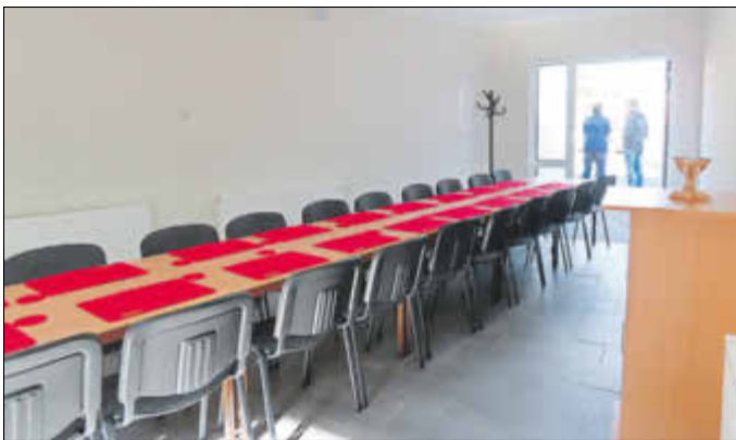
Der Blick aus dem neuen Schulungsraum nach außen.