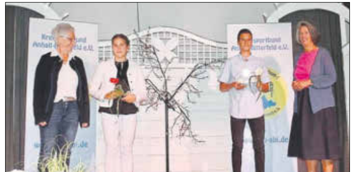
Sie nahmen die Auszeichnung von Olympiasiegerin Silke Renk-Lange und Innenministerin Tamara Zieschang entgegen.