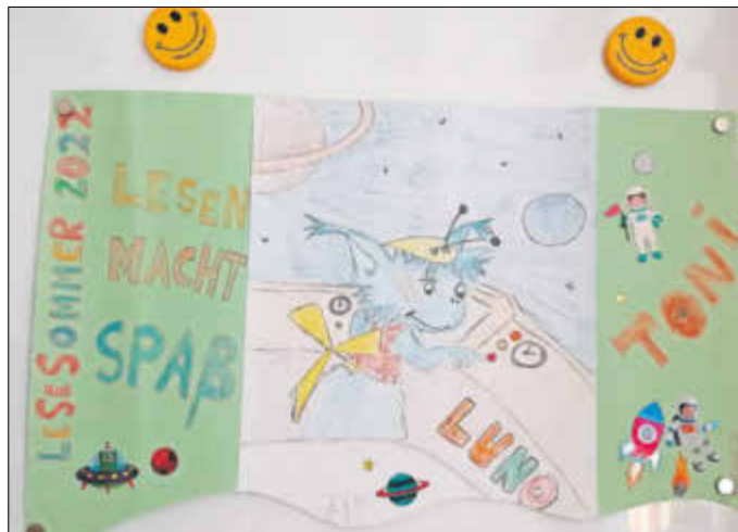
gestaltet von Toni Kehler: unter den Artikel Überschriften: Titel des Buches: Luno und der blaue Planet, Frauke Nahgang