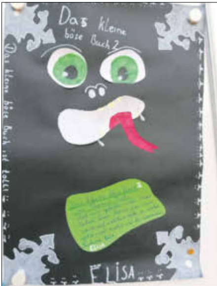
gestaltet von Elisa Kehler: Das kleine böse Buch: Magnus Myst