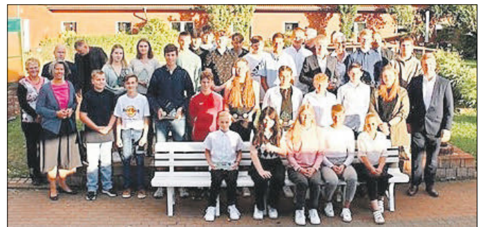
Alle Nachwuchssportler von Anhalt-Bitterfeld für 2021/2022