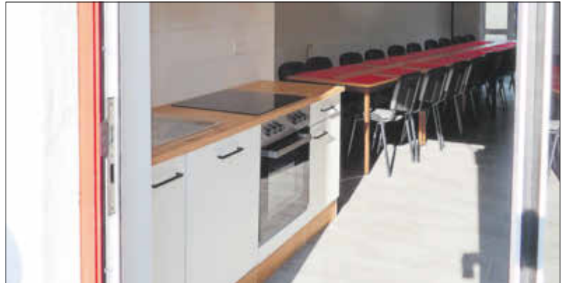
In der neuen Küche kann nun für alle Feuerwehrleute gekocht werden.