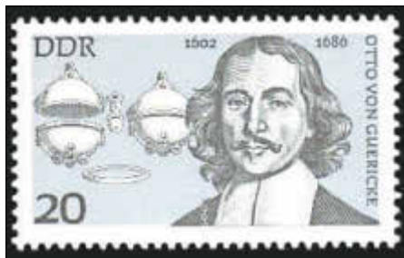
Otto von Guericke und Magdeburger Halbkugeln auf einer DDR-Briefmarke von 1977.

Die Eltern Guericke's ermöglichten ihm eine gute Bildung und Erziehung. Er studierte Jura in Leipzig und Jena. Anschließend führte er in verschiedenen Ländern während dem Studium Studien zum Festungsbau, zur Mathematik