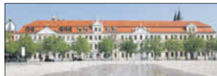
Das Haupthaus des Landtags am Domplatz in Magdeburg.

für die Einwohnerschaft oft bedeuten, zumindest abzumildern. Handeln Sie bitte so, dass Sie die Menschen, die u. U. mit der Deponie leben sollen bzw. müssen, mitnehmen! Vielen Dank!