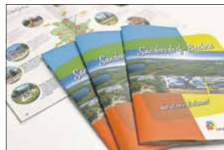
Die neue Bürgerbroschüre von und für Sandersdorf-Brehna.

Stefanie Rückauf Presse- und Öffentlichkeitsarbeit/ Stadtmarketing