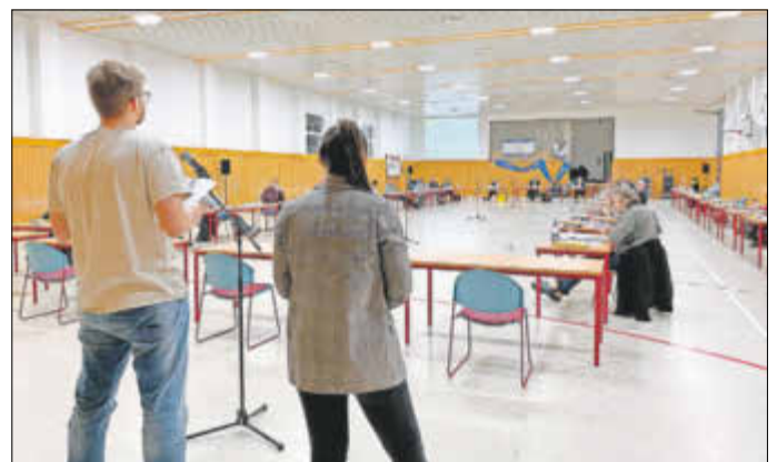
Die Vorsitzenden des Jugendbeirates tragen ihren Antrag dem Stadtrat vor.