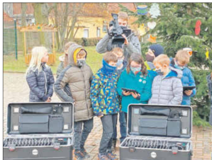
Das Team des Regionalfernsehens Bitterfeld-Wolfen (RBW)

Die nächste Ausgabe erscheint am Freitag, dem 22. Januar 2021.