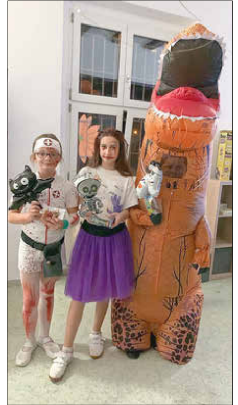
Preisverleihung für die drei besten Kostüme.

Ein Höhepunkt der Veranstaltung war der Kostümwettbewerb. Die Jury, bestehend aus dem Team des Freizeittreffs, hatte die schwierige Aufgabe, die besten Kostüme auszuwählen. Die Gewinner wurden mit Preisen belohnt. Für die Erstplatzierte gab es einen Kinogutschein.