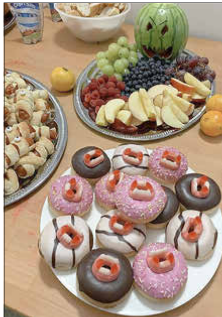
Wir bedanken uns herzlich bei EDEKA Moex in Sandersdorf für die Bereitstellung von Getränken und Snacks.

Um 17:30 Uhr wurde das Halloweenbuffet eröffnet, bei dem kein Gruselwunsch unerfüllt geblieben ist. Von Mumienwürstchen bis hin zu Vampir-donuts war für jeden Geschmack etwas dabei. Ein gruseliges Melonenmonster und ein „kotzender“ Kürbis verschönerten den Buffettisch.