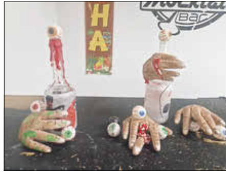
Die Bar wurde schaurig schön dekoriert.

Schon beim Betreten der Räumlichkeiten wurde deutlich, dass das hier nichts für schwache Nerven ist. Skelette hingen von der Decke und Netze mit täuschend echten Spinnen schmückten die Wände. Die Bar war mit Augen, Händen und einzelnen Fingern dekoriert, die den Besuchern einen kleinen Schauer über den Rücken jagten. Sogar die Torwand war mit den blutigen Handabdrücken so verziert, dass sie kaum noch zu erkennen war.