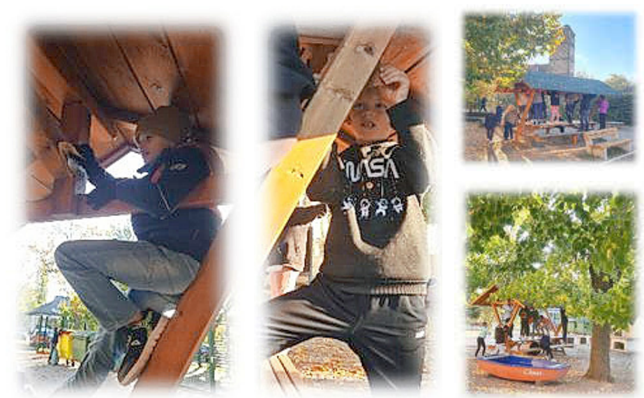
Schülerinnen und Schüler der 3. Klasse beim Schleifen.

Diese Aufgabe beanspruchte einen großen Teil der Arbeitszeit und schnell bildeten sich weitere Gruppen, um auch die anderen Aufgaben bewältigen zu können. So kümmerten sich einige Kinder gemeinsam mit den Helfern der TARGOBANK um die Lavendelfelder. Sie schnitten diese zurück und sammelten die gut riechenden Blütenstände ein, um später kleine Duftsträußchen daraus herstellen zu können. Einige Kinder reinigten mit den neuen Kehrmaschinen, Besen und Harken den