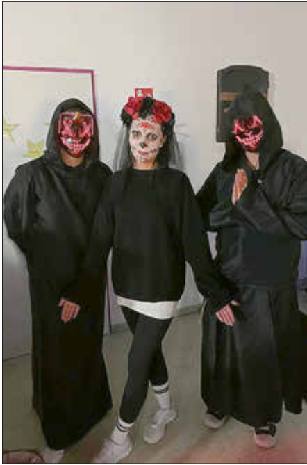
Das Team des Freizeittreffs mit ihren eigenen Kostümen.

Am Tag vor Halloween gab es im Freizeittreff bereits einen guten Grund zum Gruseln: Die diesjährige Halloweenparty wurde gefeiert. Das engagierte Team hatte zahlreiche schaurig schöne Überraschungen für die Kinder und Jugendlichen vorbereitet, die für eine unvergessliche Atmosphäre sorgten.