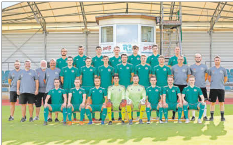
Die SG Union Sandersdorf mit ihrem Oberligateam der Saison 2019/20

nell zum 21. FORD-Cup in die Dessauer Anhalt-Arena. Auch wenn man hier vielleicht nicht den Favoritenstempel trägt, so fahren die Unioner diesmal aber erneut als Vorjahressieger und damit Titelverteidiger in die Muldestadt. Sollten sich dann keine zusätzlichen kurz eingewilligten Hallenverpflichtungen mehr ergeben, gilt der Blick der Wintervorbereitung auf die Rückrunde. Diese startet für die SG Union Sandersdorf voraussichtlich am Sonntag, 23. Februar 2020 mit dem schweren Heimspiel gegen den FC Einheit Rudolstadt. Und sollte man im Juni 2020 folglich immer noch auf Platz 6 oder gar besser dastehen, dann hätte man mit dem im Volksmund „verflixten 7. Jahr“ das beste Ergebnis der Zugehörigkeit zu dieser Oberliga Süd eingefahren.