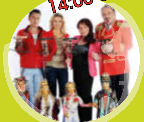
Marionetten Theater Woitschack Räuber Hotzenplotz

MIT WINZERN AUS DER SAALE-UNSTRUT REGION MIT DER ORTSFEUERWEHR BREHNA & VIELEN ANGEBOTEN FÜR GROß & KLEIN