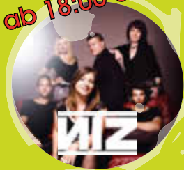
NOCH IST ZEIT