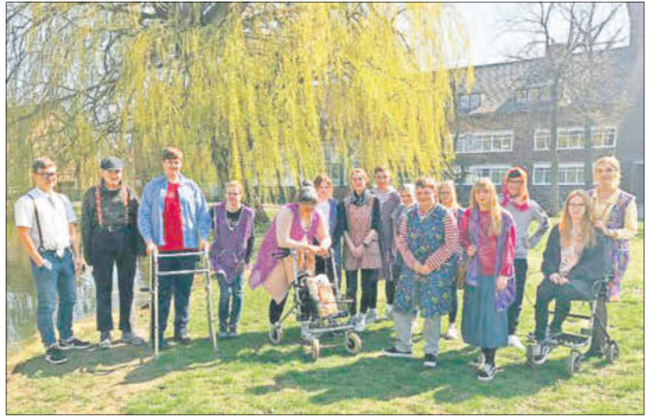
Und die Sekundarschüler verkleideten sich passend zu dem Motto „Oldies“.

In der Woche vom 1. April bis 5. April fand in der Sekundarschule Roitzsch und dem Walther-Rathenau-Gymnasium Bitterfeld die Mottowoche statt. Dabei verkleiden sich die Schüler und Schülerinnen jeden Tag getreu eines Mottos. So unterstützten wir die Jugendlichen mit Kostümen, aber auch mit der passenden Schminke im Gesicht.