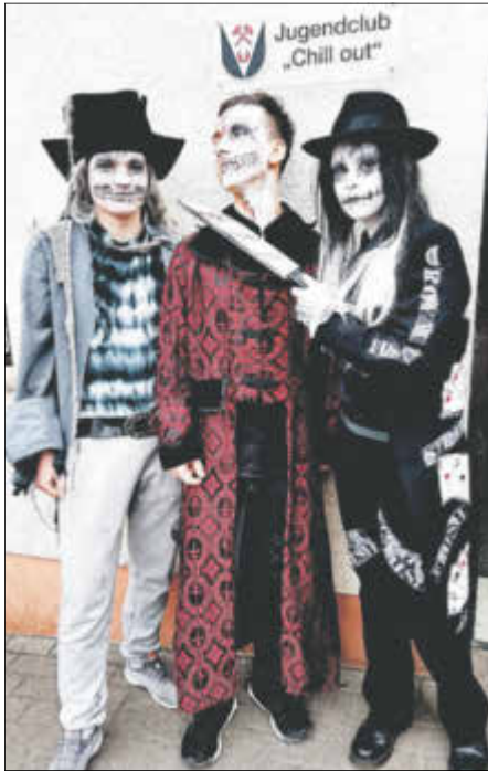
So hatte zum Beispiel das Gymnasium am Mittwoch das Motto „Horror“.