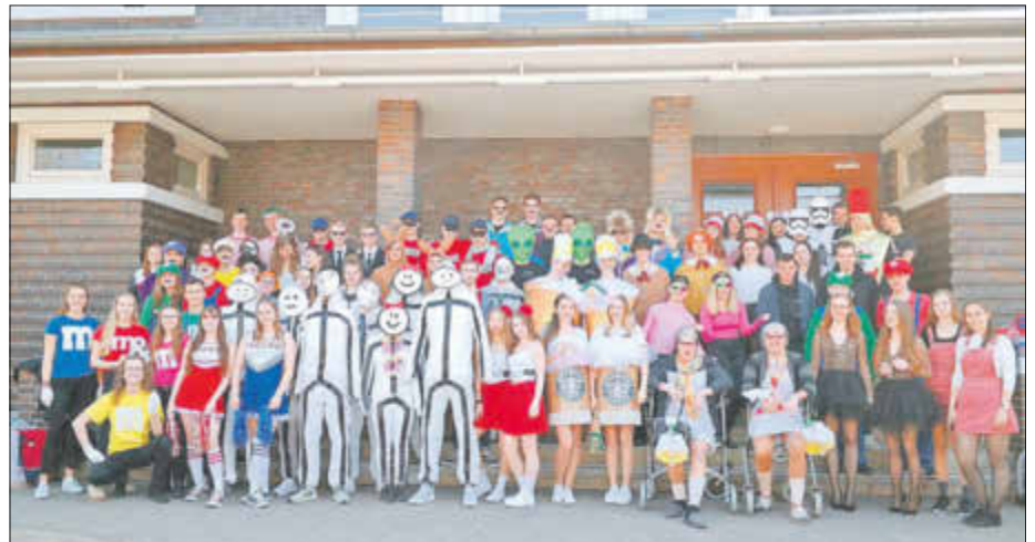
Hier war das Motto des Gymnasiums „Zwillinge“.

Nicht nur Lehrer und andere Schüler, sondern auch ehemalige Schüler und Freunde der Abiturienten schauten sich das Spektakel an.