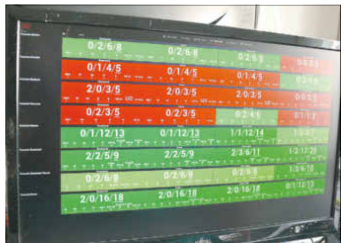
Am Monitor hat man den Überblick über die gesamte aktuelle Einsatzstärke.